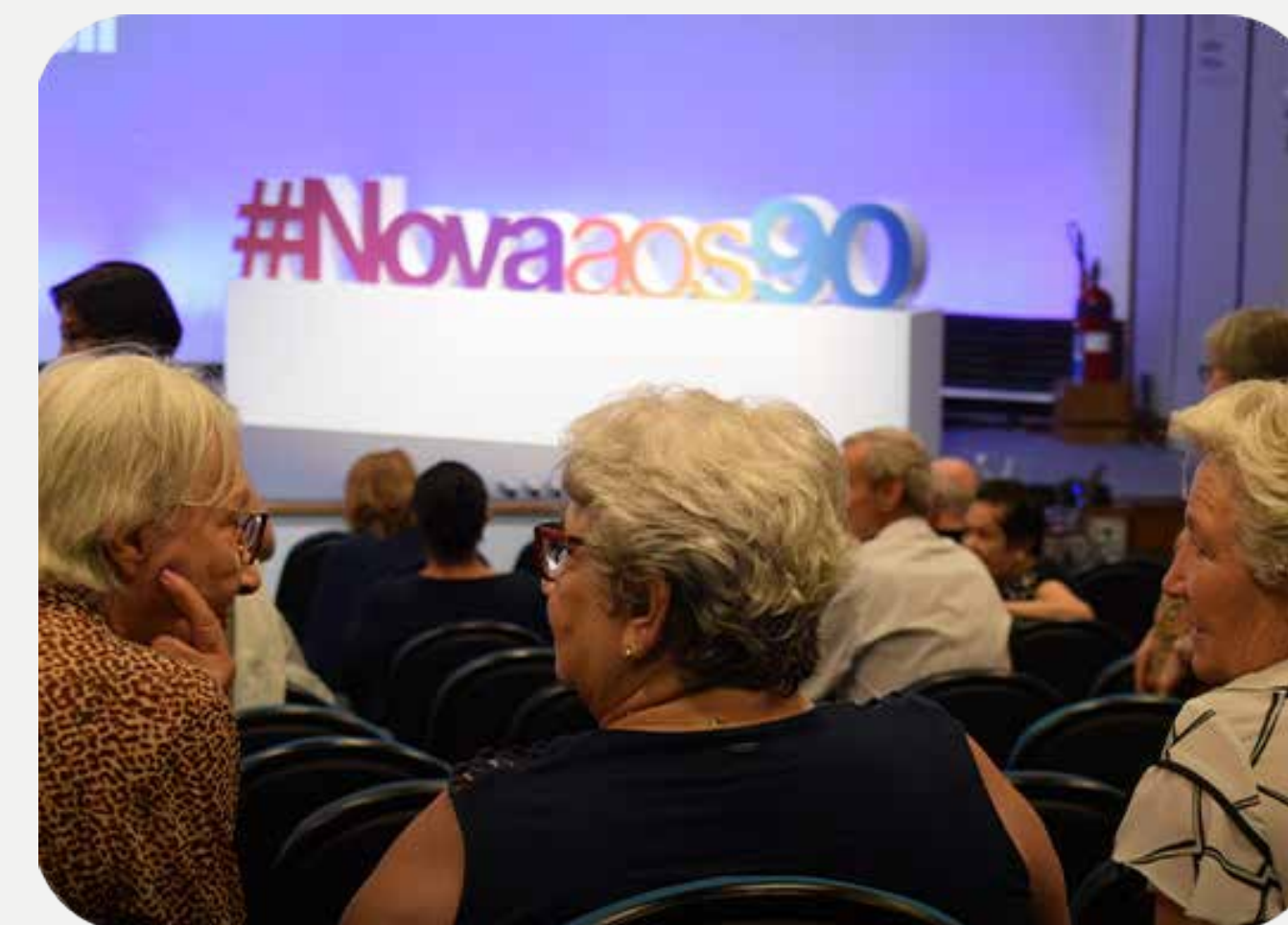
Encontro anual dos aposentados - Comemoração 90 anos Novartis Brasil

Essa oportunidade tem como objetivo proporcionar mais tranquilidade aos assistidos, de forma a adequar seus benefícios com as atuais necessidades.