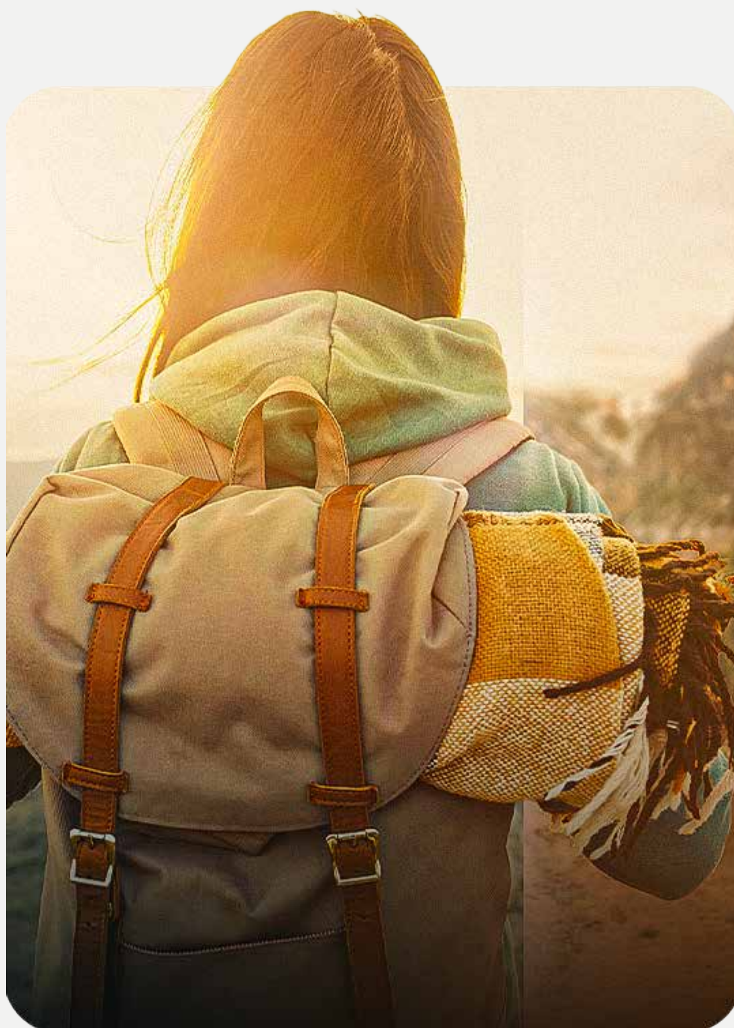
Campanha Alteração de Perfil de Investimentos